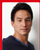
競泳 松田 丈志

https://eneos-seika-2020.jp/routewalk/fukushima/index.html