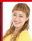
サッカー 丸山 桂里奈