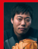
野球 上原 浩治